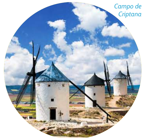
Campo de Criptana