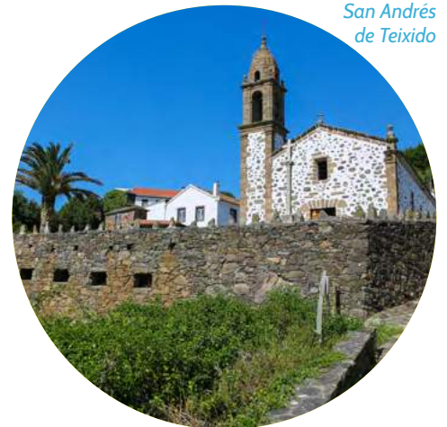
San Andrés de Teixido