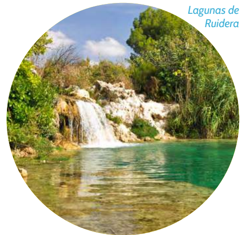
Lagunas de Ruidera