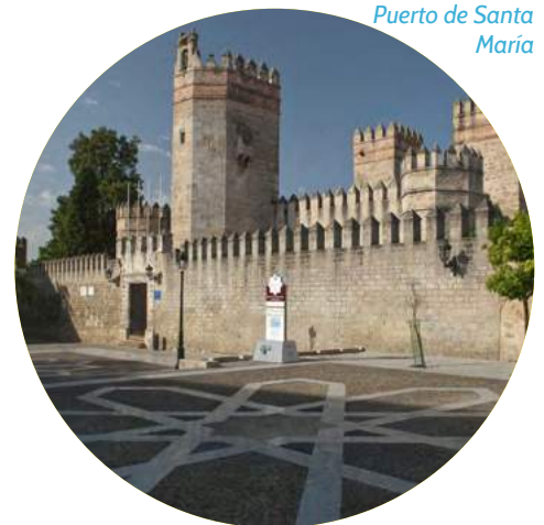
Puerto de Santa María