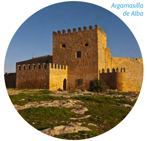
Argamasilla de Alba

DÍA 6. TOLEDO - ORIGEN: desayuno. Salida a primera hora de la mañana para viaje de regreso. Paradas en ruta (almuerzo por cuenta del cliente) Llegada y fin de nuestros servicios.