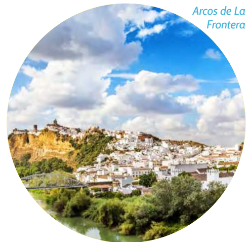
Arcos de La Frontera